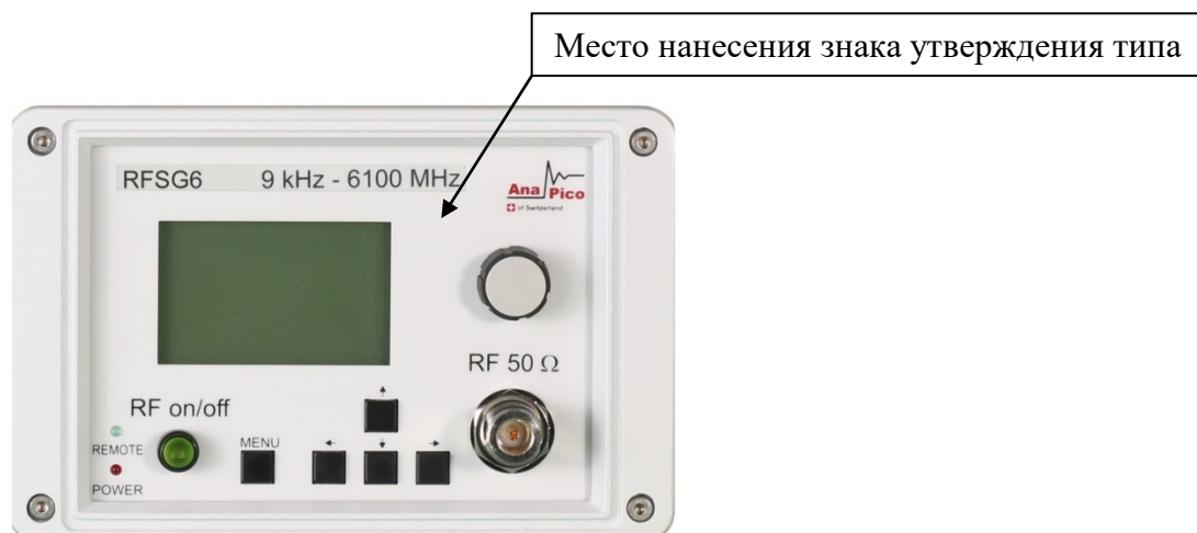
Рисунок 1 - Общий вид лицевой панели генераторов сигналов RFSG2, RFSG4, RFSG6

Общий вид генераторов с указанием мест нанесения знака поверки, знака утверждения типа и пломбирования приведён на рисунках 1 - 6.