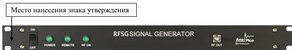
Рисунок 5 - Общий вид лицевой панели генераторов сигналов RFSG12, RFSG20, RFSG26 с опциями RFSG12-1URM, RFSG20-1URM, RFSG26-1URM соответственно