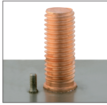
Semi-automatic and fully automatic feed of studs with flange as per DIN EN ISO 13918