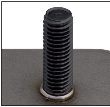
Hochfester Bolzen HZ-1 perfekt mit SRM® geschweißt High-strength weld stud HZ-1 perfectly welded using SRM®