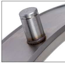
Kleiner, gleichmäßiger spritzerfreier Schweißwulst Small, regular and spatter-free weld collar