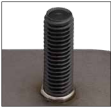
Hochfester Bolzen HZ-1 perfekt mit SRM ® geschweißt High-strength weld stud HZ-1 perfectly welded using SRM ®