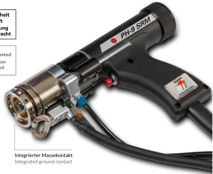
Integrierter Massekontakt Integrated ground contact