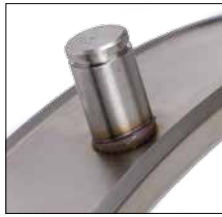
Kleiner, gleichmäßiger spritzerfreier Schweißwulst Small, regular and spatter-free weld collar