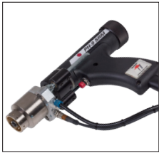
Die Schweißpistole PH-9 SRM 12 ist die Standardpistole für das Bolzenschweißgerät BMK-10i The PH-9 SRM 12 is the standard gun for the BMK-10i stud welder