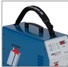
Ein Tragegurt wird serienmäßig zu jedem BMK-10i mitgeliefert Each BMK-10i is equipped with a carrying strap as standard