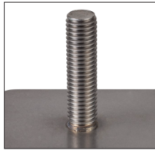
Kleiner, gleichmäßiger spritzerfreier Schweißwulst Small, regular and spatter-free weld collar