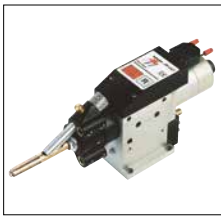
Standardschweißkopf SK-5AP SK-5AP standard welding head