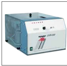
Universlrüttler UVR-300 zur vollautomatischen Bolzenzuführung